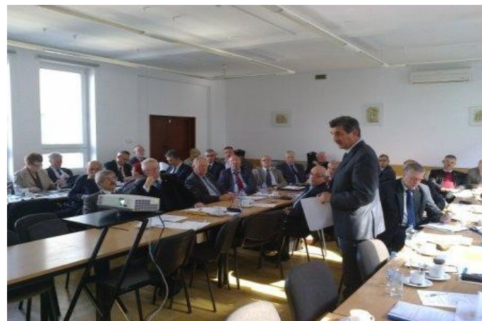
Fot. 3—sala obrad

Oprac. Bolesław Pałac, prezes Oddziału Rzeszowskiego SEP