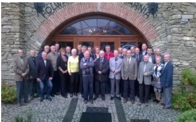
Fot. 5 – uczestnicy spotkania